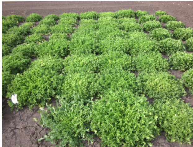
DEU146 CICH 535