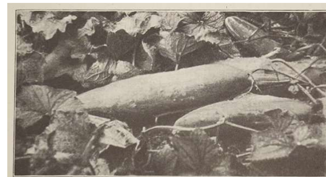
Abb. 468. Riesenfreilandgurke Graf Zeppelin, Original. (Aufnahme bei S. Schneider, Stuttgart.)

Quelle: Müllers, Lambert; Wehrhahn, Heinz Rudolf (1935 ca.): Gemüsebau