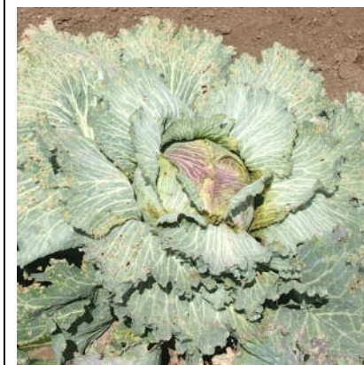
19.08.2019 beim BSA