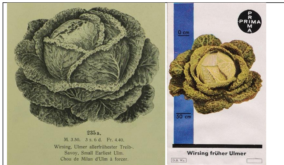
Benary (ohne Jahr)